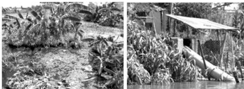
Khu vực vàm rạch Rạp bị ô nhiễm bởi nước thải từ Công ty TNHH Đại Tây Dương (10), và Ống bơm xả trực tiếp nước thải, không xử lý, từ một ao nuôi cá vào sông Hậu (24)

Song hành với việc người dân thi nhau nuôi cá tra là sự phát triển các nhà máy chế biến sản phẩm cá tra xuất khẩu trong các KCN Thốt Nốt, Trà Nóc 1 và Trà Nóc 2, nằm dọc theo sông Hậu. KCN Thốt Nốt có 4 nhà máy sản xuất thủy sản và trong 2 năm 2007, 2008 hai nhà máy Đại Tây Dương và Ấn Độ Dương đã bị xử phạt hành chính do xả nước thải chưa qua xử lý ra sông Hậu, độ ô nhiễm từ mỡ cá vượt mức cho phép đến 150 lần (10, 11). Trong khi đó ở KCN Trà Nóc 1 (hoạt động từ năm 1994), KCN Trà Nóc 2 (hoạt động từ năm 2000), nhưng chỉ có 28/300 nhà máy có xây dựng hệ thống xử lý nước thải. Tổng lượng nước thải không xử lý của cả 2 KCN này lên đến trên 12.000 m 3 /ngày, theo 17 cửa xả nước mưa đổ ra sông Hậu. Kiểm tra mẫu nước thải tại cửa xả tiếp giáp với sông Hậu cho thấy: lượng chất thải SS = 12.760 mg/l, lượng N = 171 mg/l, S = 9,8 mg/l, riêng coliform lên đến 2400MPN/ml. Chỉ số này vượt mức cho phép của nước sinh hoạt TCVN 5942-A từ 100 - 600 lần (12).