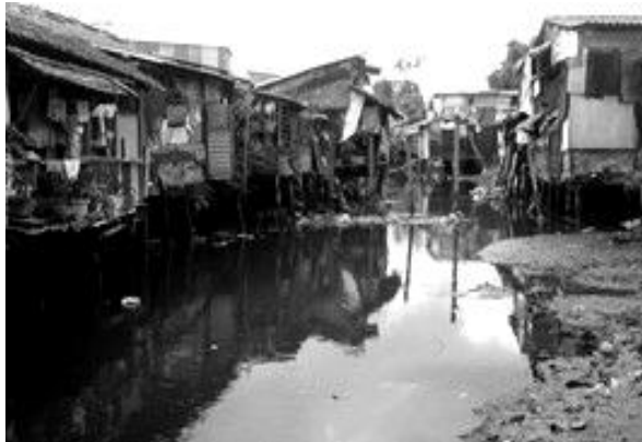
Nguồn nước rạch Tham Tướng bị ô nhiễm trầm trọng (29)

Ngoài ra một số kinh rạch nhỏ khác ở vùng ngoại thành cũng bị ô nhiễm. Mẫu nước lấy ở vàm rạch Bông Vang (giáp với sông Bình Thủy) và vàm rạch Cái Sơn (giáp với rạch Trà Nóc) có chỉ số BOD biên đôi trong khoảng 10 - 50mg/l; ở rạch Ông Tường, rạch Súc, chỉ số BOD tương đối cao (15 - 30mg/l). Nước rạch San Trắng Lớn bị ô nhiễm nhẹ, BOD = 8 - 12mg/l, trong khi ở rạch San Trắng Nhỏ tương đối trầm trọng hơn, BOD = 12 - 30mg/l, do nước thải từ khu công nghiệp biến chế thực phẩm. Riêng rạch Trôm, rạch Nọc và rạch Bò Ót, BOD tương đối cao (20 - 50mg/l) do nước thải của các hộ gia cư và hóa chất nông nghiệp. Một số rạch khác tuy kích thước khá lớn như Cái Sâu, Cái Đồi, Cái Nai và Cái Da, nhưng do ăn thông với nhau nên dòng nước chảy chậm, BOD = 12 - 15mg/l nơi giáp sông Cần Thơ và 70 - 80mg trong rạch Cái Sâu (12).