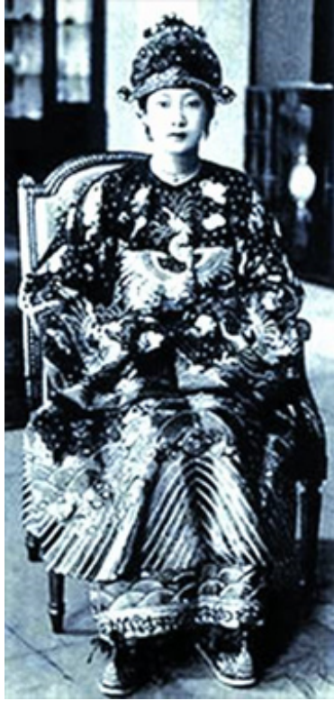
Nam Phương hoàng hậu, cháu ngoại của Huyện Sĩ