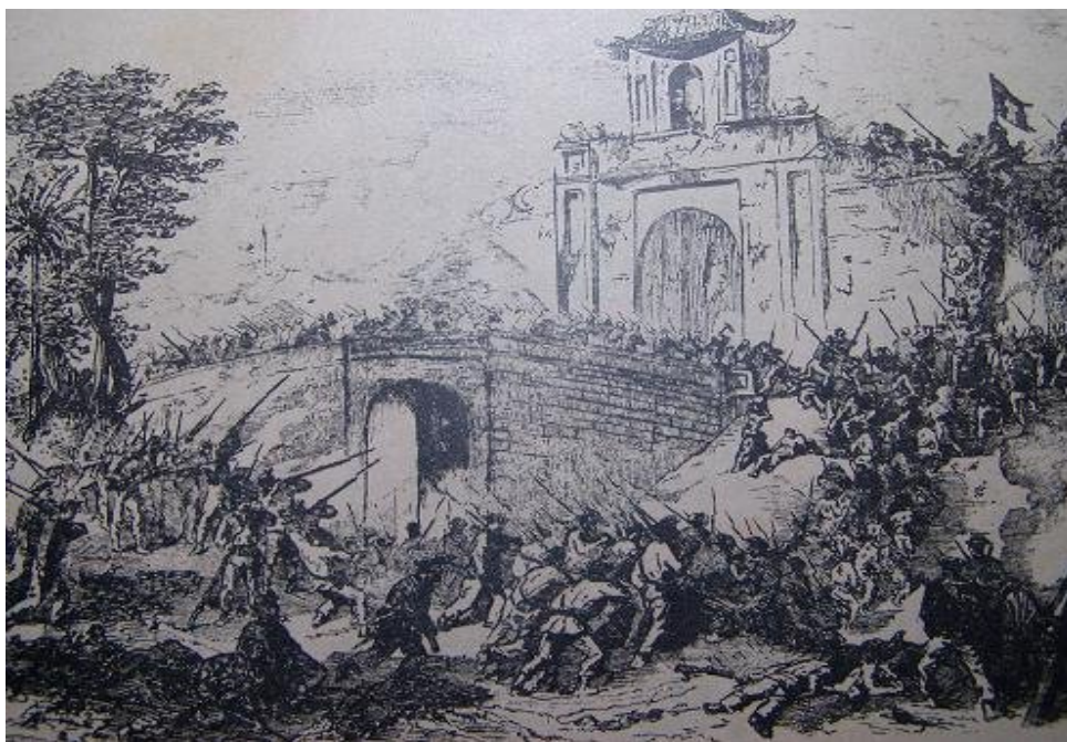
Cảnh đấỵ, người đấỵ luống đoạn trường

Thành mới nằm ở góc Đông Bắc thành cũ và đối chiếu với ngày nay, vị trí của thành Gia Định nằm trong phạm vi bốn con đường: Nguyễn Du là mặt tiền; Nguyễn Đình Chiểu mặt hậu; Nguyễn Bình Khiêm mặt tả; Mạc Đĩnh Chi mặt hữu.