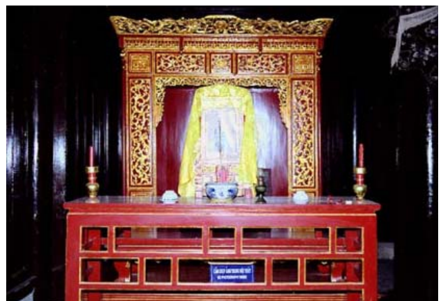
Autel funéraire de Duc Duc

Et pourtant, le tombeau de Duc Duc est beau, avec le magnifique temple de Long An au centre de la nécropole (qui couvre à peine un demi-hectare) d'une architecture fine et traditionnelle de Huê - alors que celui de Khai Dinh est mâtiné d'Occident - mais surtout par son origine : c'est son fils qui l'a fait ériger. Or, nos anciens monarques faisaient d'habitude bâtir leur dernière demeure de leur vivant, comme nous le savons. Et ces tombeaux comportent normalement un pavillon dit de la stèle, ladite stèle (une plaque de minéral précieux gravée) relatant les mérites vrais ou prétendus des défunts. Le tombeau de Duc Duc ne comporte pas de stèle, mais 3 autels funéraires assez similaires, dédiés aux mânes des trois rois.