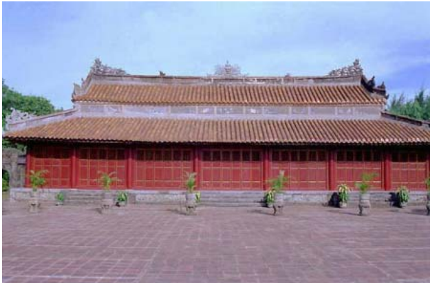
Tombeau de Duc Duc – temple Long An

Les touristes arrivant dans l'ancienne capitale impériale de Huê, au centre du Viet Nam, ne manquent jamais de visiter au moins un des tombeaux de nos anciens souverains disséminés autour de la ville. Ils ont raison : ces tombeaux sont splendides, malgré leur rénovation très épisodique (seul le temple Long An a été totalement rénové, en ce qui concerne le tombeau de Duc Duc), et dictée surtout par leur classement par l'UNESCO en 1994. Auparavant, ils étaient laissés à l'abandon, de par un sectarisme maintenant hors de propos avec l'ouverture.