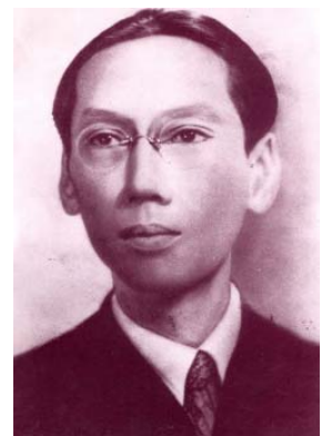
Duy Tân, à La Réunion

Malheureusement pour lui, il était doté d'un caractère non attendu de la part d'un souverain d'Asie : il aimait se promener incognito (4) parmi son peuple pour bavarder avec lui, se renseigner, se déguiser, agir de manière visible, bref, il était...naturel. Les Français le craignant, sautèrent sur l'occasion, le taxèrent de folie et le déposèrent en 1907, l'obligeant à abdiquer en faveur de son fils Vinh San. Il fut d'abord exilé à au Cap St Jacques - actuel Vung Tàu (5) - puis à l'île de La Réunion .