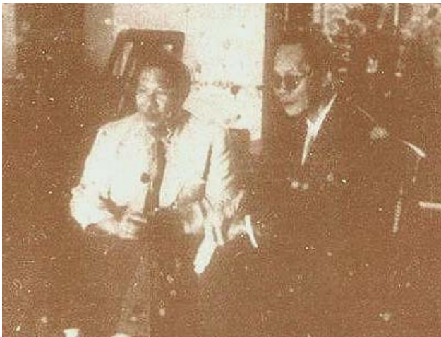
Bao Dai en compagnie de Thanh Thai en 1953

Avec les supputations politiques suivant la fin de la 2 e guerre mondiale qui a vu la fin de la monarchie vietnamienne en août 1945, il fut autorisé à revenir sur le sol natal, au Cap St Jacques, où il décéda en mars 1954, deux mois avant la chute du camp de Diên Biên Phu, en mai. Il s'était réconcilié (?) avec le dernier empereur Nguyễn, Bao Dai, alors Chef de l'Etat (Quốc Truong) du Vietnam. Celui-ci lui montrait tous les signes possibles de respect (regret d'avoir en quelque sorte eu un père – Khai Dinh - monté sur le trône de manière non dynastique ?) et lui fit verser une pension jusqu'à son décès. Exit le 10 e empereur Nguyễn.