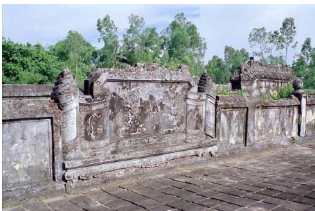
Tombeau de Duc Duc – mur d'enceinte

Les touristes arrivant dans l'ancienne capitale impériale de Huê, au centre du Viet Nam, ne manquent jamais de visiter au moins un des tombeaux de nos anciens souverains disséminés autour de la ville. Ils ont raison : ces tombeaux sont splendides, malgré leur rénovation très épisodique (seul le temple Long An a été totalement rénové, en ce qui concerne le tombeau de Duc Duc), et dictée surtout par leur classement par l'UNESCO en 1994. Auparavant, ils étaient laissés à l'abandon, de par un sectarisme maintenant hors de propos avec l'ouverture.