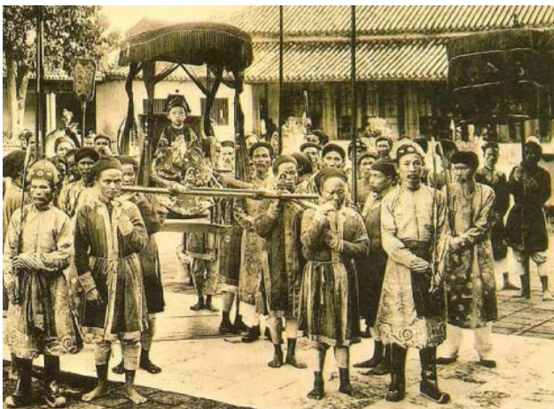
Intronisation de Duy-Tân en 1907

Juillet 1907 Le prince Vinh San monte donc sur ce qui reste de trône, 11 e souverain Nguyễn, à l'âge de 7 ans seulement, sous le nom de règne de Duy Tân. Bientôt beau, jeune, intelligent, et réformiste dans l'âme malgré le peu de pouvoir qui lui reste, il ne tarde pas à être très aimé de la population, mais se rend compte également très vite qu'il n'aura jamais les mains libres. Très jeune roi encore pur, et fougueux, il mène une rébellion dès 1916 (il avait 16 ans !), très vite