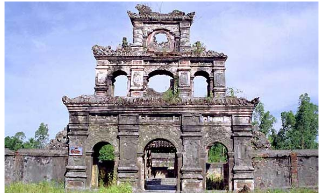
Portail du tombeau de Duc Duc

Ils ont été les 3 empereurs parmi les plus malheureux de notre histoire du 19 e et du 20 e siècle: le premier est mort emmuré vivant, les deux autres ont été exilés (1).