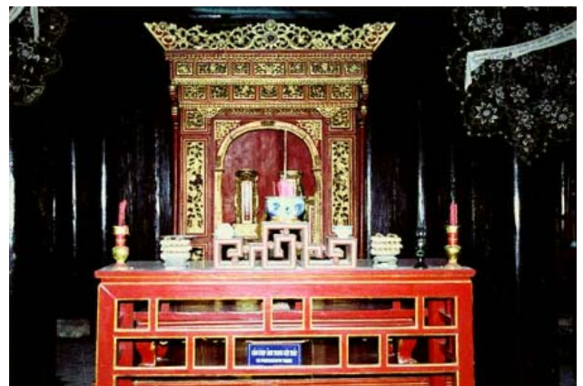
Autel funéraire de Thành Thai

Malheureusement pour lui, il était doté d'un caractère non attendu de la part d'un souverain d'Asie : il aimait se promener incognito (4) parmi son peuple pour bavarder avec lui, se renseigner, se déguiser, agir de manière visible, bref, il était...naturel. Les Français le craignant, sautèrent sur l'occasion, le taxèrent de folie et le déposèrent en 1907, l'obligeant à abdiquer en faveur de son fils Vinh San. Il fut d'abord exilé à au Cap St Jacques - actuel Vung Tàu (5) - puis à l'île de La Réunion .