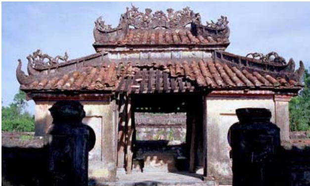
Tombeau de Duc Duc – un pavillon, restauré depuis.

Et l'histoire de ces 3 défunts est très belle, de par leur côté tragique. Relatons-en de nouveau et en peu de mots la trame.