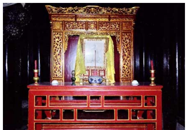
Autel funéraire de Duy Tân

Chef de bataillon (commandant d'infanterie) à la fin de la guerre, il rencontra De Gaulle qui envisageait sa restauration. Bao Dai avait en effet abdiqué en 1945, et la France était face à Hồ Chí Minh. Duy Tân devait revenir au Viet Nam en 1946. Malheureusement, un accident d'avion en décembre 1945 en Afrique provoqua sa mort, dans des conditions non encore totalement élucidées (Anglais ? Américains ? la Nature ?).