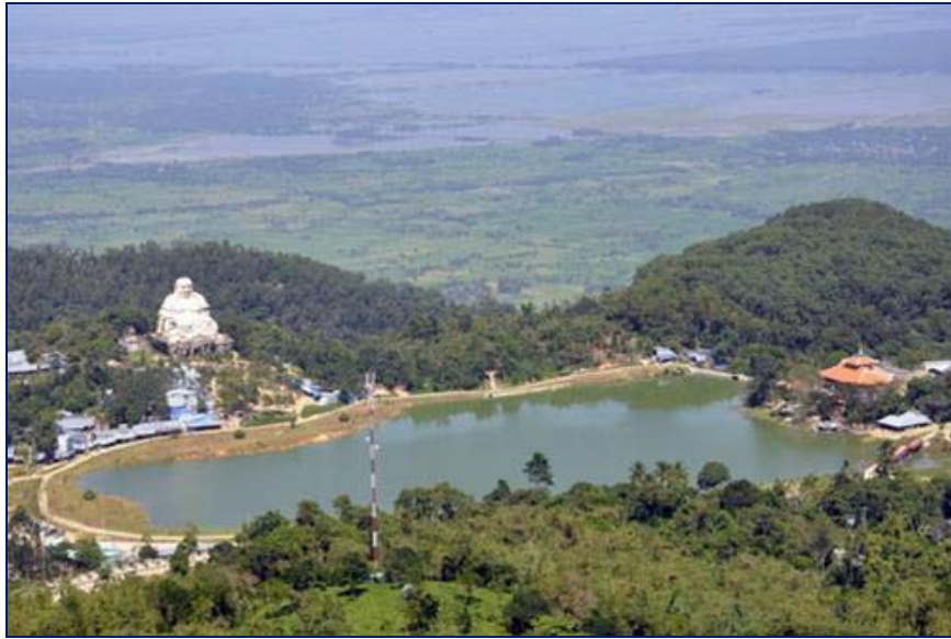
Nhìn từ núi Ông Cấm

Thất Sơn, cái tên rất quen mà rất lạ. Quen bởi bất cứ ai sống ở Nam bộ đều biết đó là bảy ngọn núi huyền thoại ở tỉnh An Giang. Lạ vì mấy ai đã thật sự đặt chân tới ngàn ấy đỉnh núi.