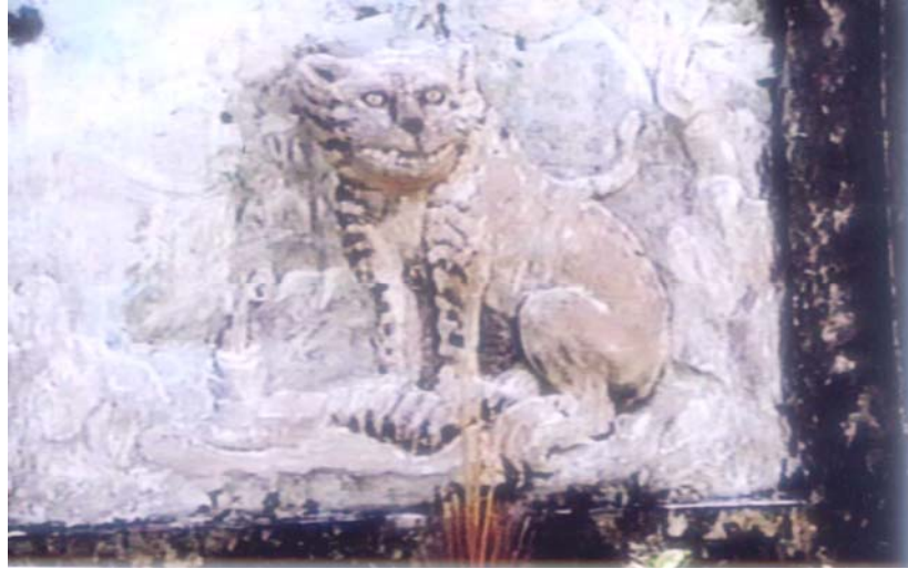
Bia Thần hổ trước đình Dĩ An (hình chụp 1990)