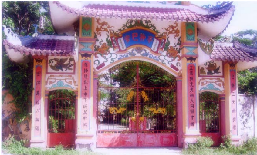
Cổng đình Dĩ An (xây lại năm Mậu Dần, 1998)