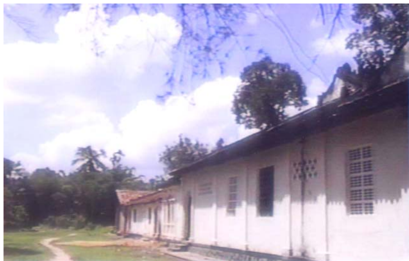
Đình Dĩ An nhìn từ bên hông (hình chụp 1990)