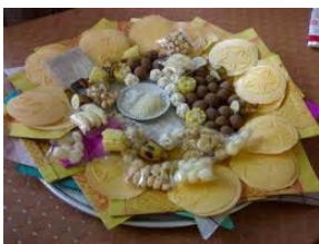
Mâm cúng cô hồn

Buổi cúng thường kết thúc với việc vãi gạo, muối ra sân, ra đường và đốt vàng mã. Ở vài nơi, người ta cho phép trẻ con giành giật đồ cúng khi việc cúng được tiến hành xong và gọi đó là “thí” cô hồn. Có lẽ cách gọi như vậy cũng hàm ý đa nghĩa!