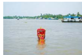
Thuyền tổng ôn - tổng gió trôi giữa dòng nước

than hồng, người ta rắc muối hạt vào đó, tiếng muối nổ lóp bốp, như tăng thêm phần độc đáo cho buổi tổng ôn.