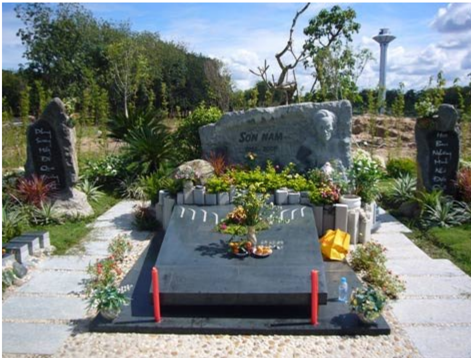
Ngôi mộ nhà văn Sơn Nam tại ấp 1B, xã Chánh Phú Hòa, Bến Cát, Bình Dương

Bên ngoài phần mộ có hai tảng đá to với hai câu thơ kết trong bài thơ “Không đề” do chính Sơn Nam sáng tác được viết thay lời tựa trong tác phẩm nổi tiếng Hương rừng Cà Mau . Bên trái “Phong sương mấy độ qua đường phố”, bên phải “Hạt bụi nghiêng mình nhớ đất quê”.