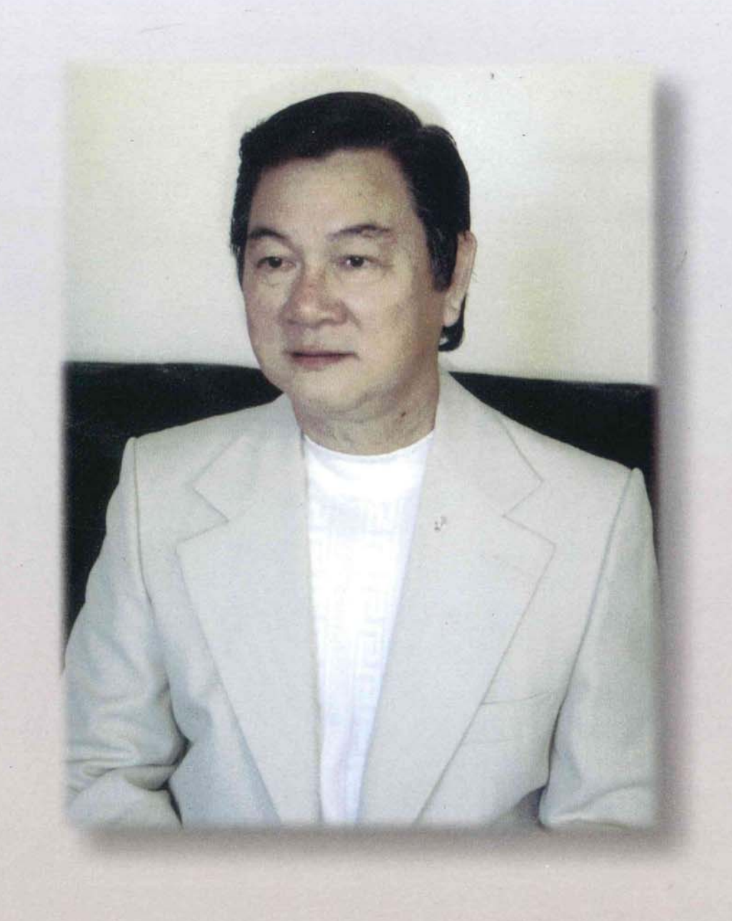
Đầu sông, cuối sông... trở thành vô-nghĩa Khi ta và Xứ-sở Vẫn ngậm-ngùi ở bờ đại-dương!